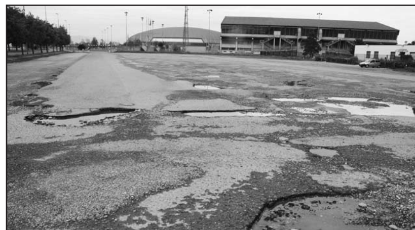
Attenti alle voragini... e alle sospensioni.