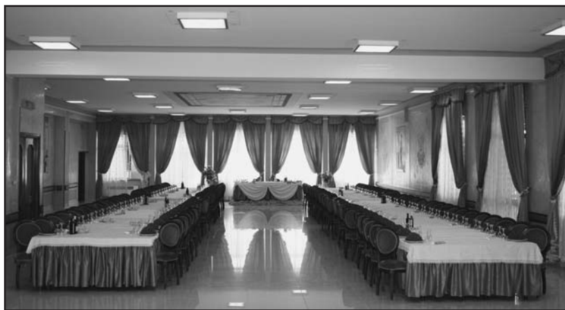
Una delle sale pronta ad accogliere gli sposi.