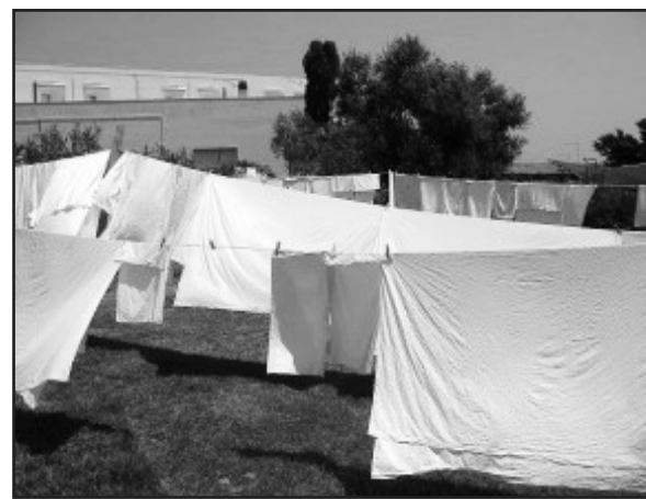
Il bucato steso sul prato.

Lei aveva infine un'ultima strategia, forse portata dalla