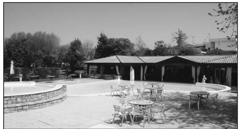
Piscina relax nell'accogliente parco a tema.