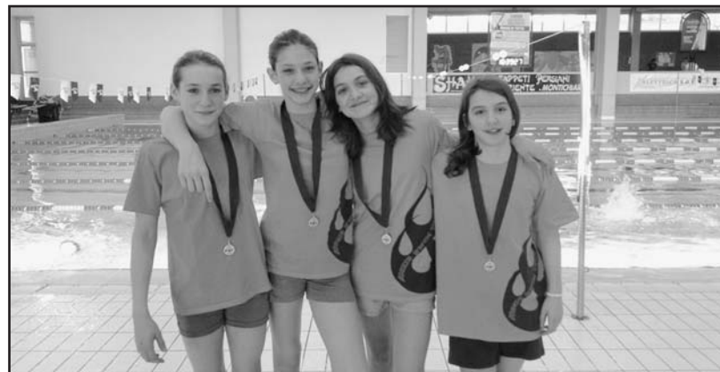
STAFFETTA 4x200 STILE LIBERO Femmine - Vice Campionesse Regionali 9.37.15